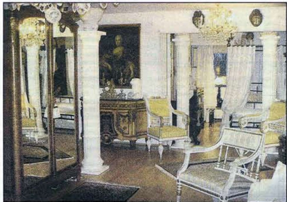
Kokonaisuus on tärkeää sisustuksessa.

— Solmitut matot kannattaa aina ostaa matto-alan