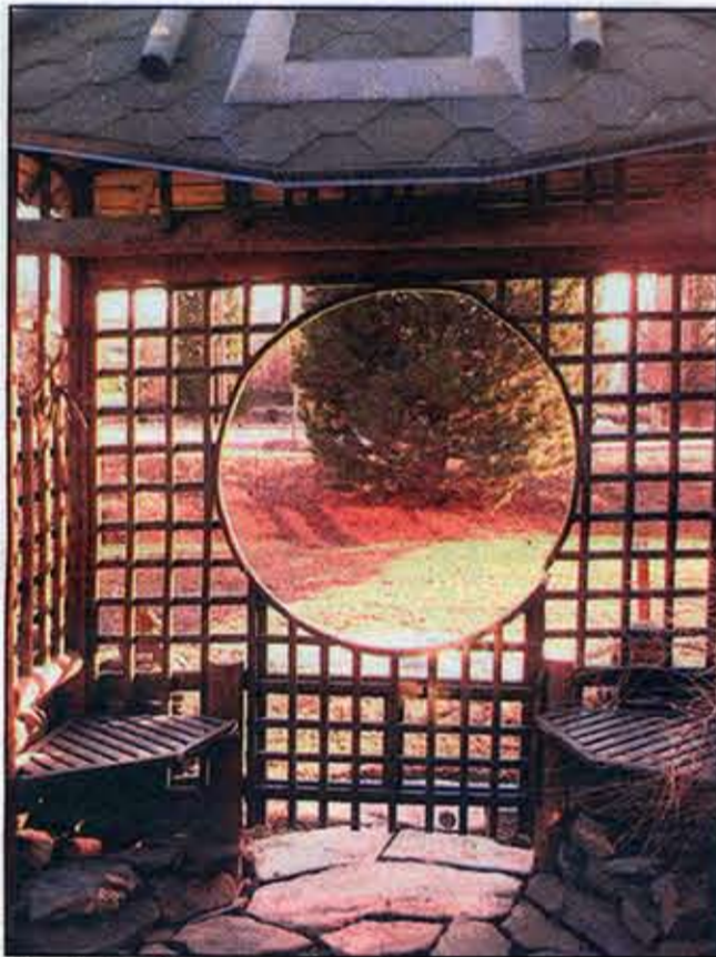
Hautaloiden itämaisessä puutarhassa on monenlaisia eri elementtejä. Pääosin ne ovat kiveä ja puuta. Muodot ja linjat ovat tarkkaan suunniteltuja.

Puutarhan laittamisessa peräänkuulutetaan nykyään myös omaperäisyyttä. Tyyleinä voivat olla vaikkapa kiinalainen ja japanilainen puutarha, joissa on paljon samanlaisia elementtejä.